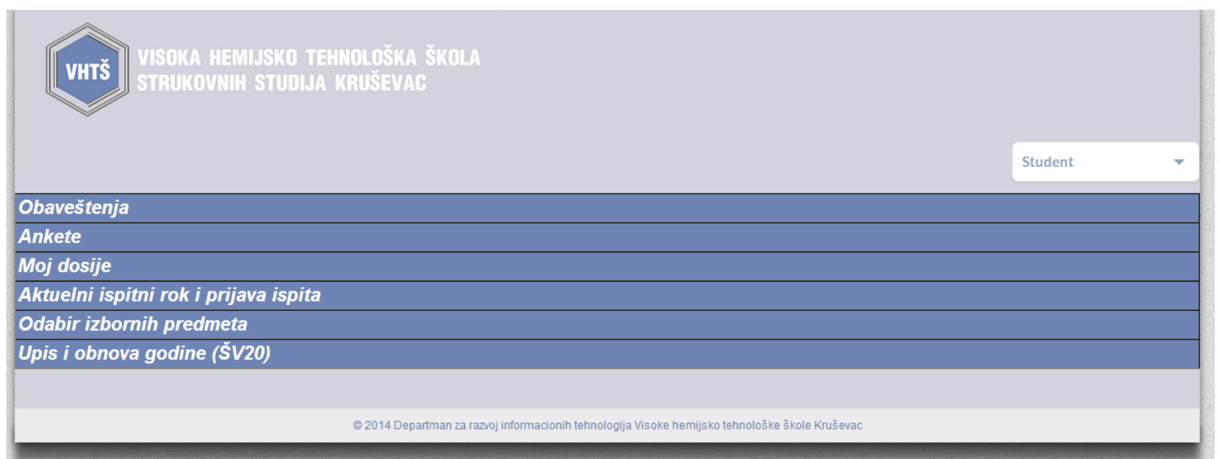
Slika 4. Izgled početne strane studentskog panela

Studenti na svom panelu mogu da primaju obaveštenja od studentske službe ili profesora (samo od onih kod kojih slušaju predmet i u semestru u kome slušaju predmet).